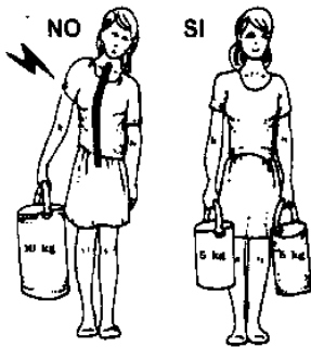
BILANCIARE SEMPRE I CARICHI