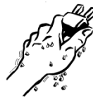
NO MANI BAGNATE