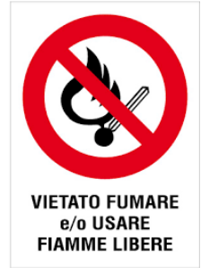
VIETATO FUMARE e/o USARE FIAMME LIBERE

L'incendio è la combustione (reazione chimica di un combustibile con un comburente in presenza di innesco) sufficientemente rapida e non controllata che può svilupparsi senza limitazioni nello spazio e nel tempo. Il rischio di incendio è sempre presente in qualsiasi attività lavorativa.